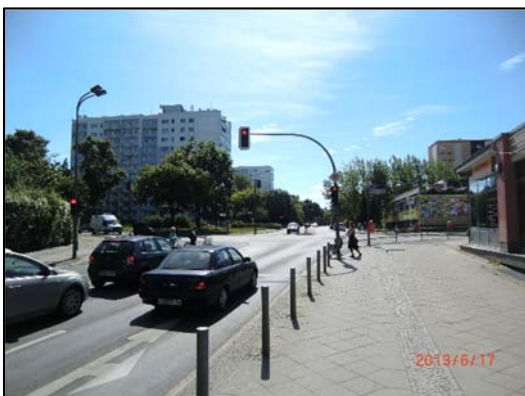
Blick Richtung Osten