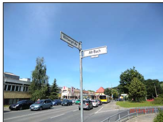
Blick Richtung Westen