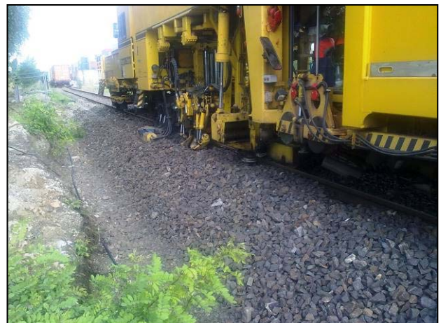
Stopfmaschine im Einsatz