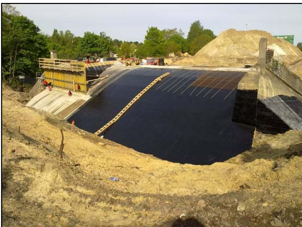
EÜ mit neuer Abdichtung